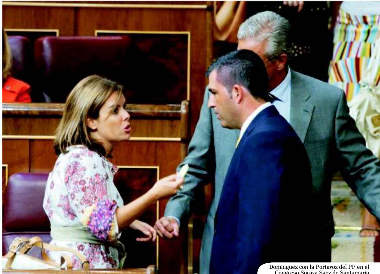
Dominguez con la Portavoz del PP en el Congreso Soraya Sáez de Santamaría